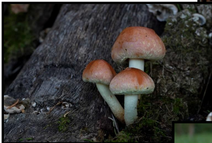
Rode zwavelkop, 't Plat