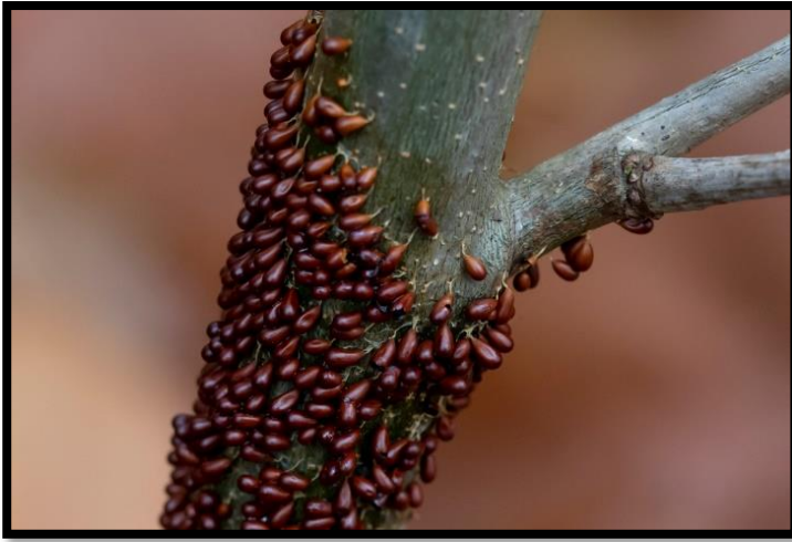
Glanzend druivenpitje, Resterheide