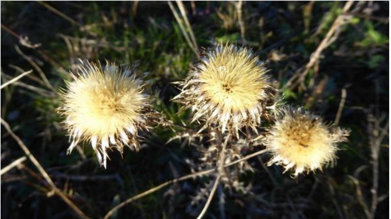
driedistel terril zwartberg