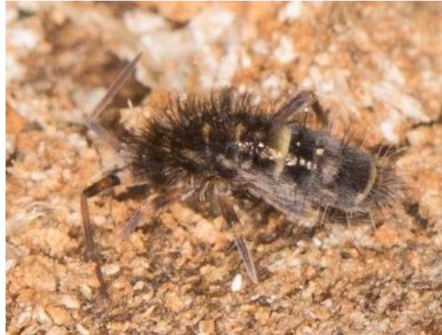
Springstaartje ( Orchesella cincta )