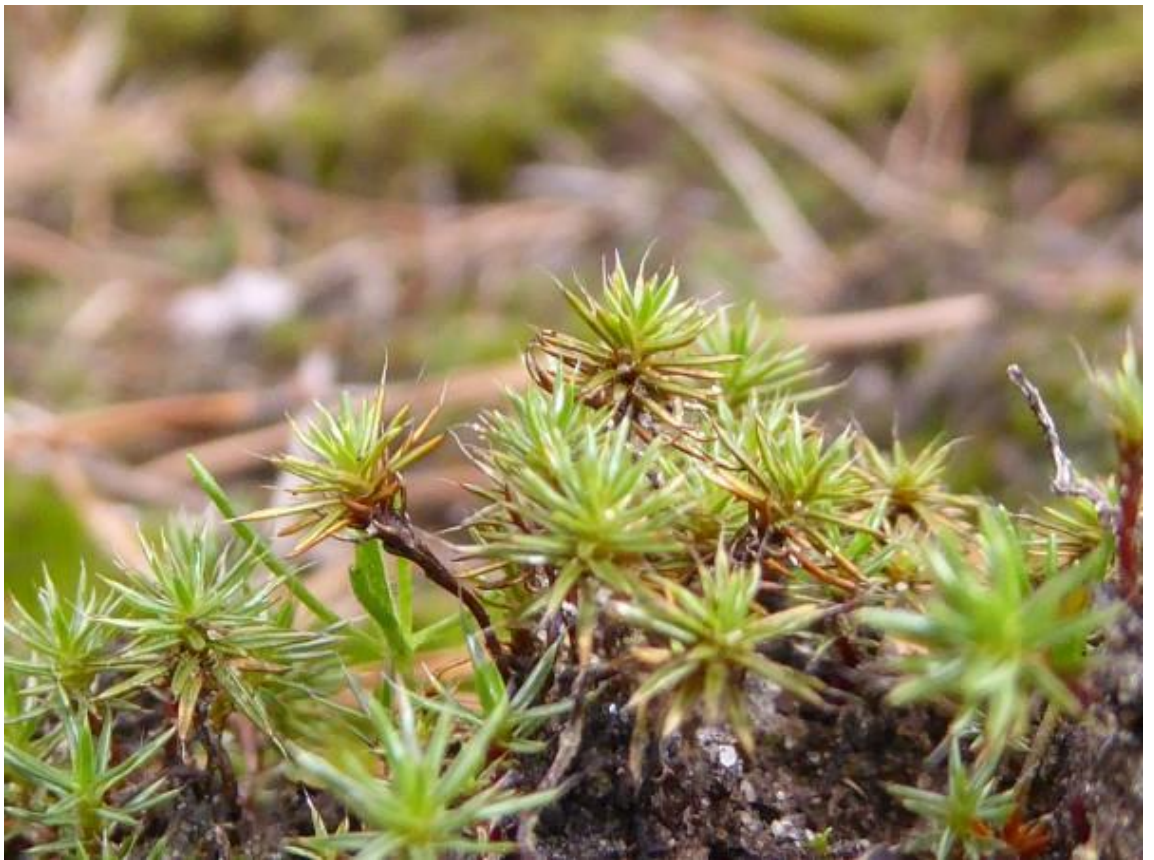
ruig haarmos leenderheide