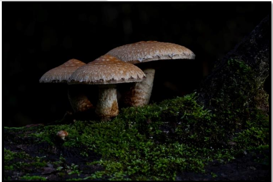
Wollige bundelzwam, Weerterbos