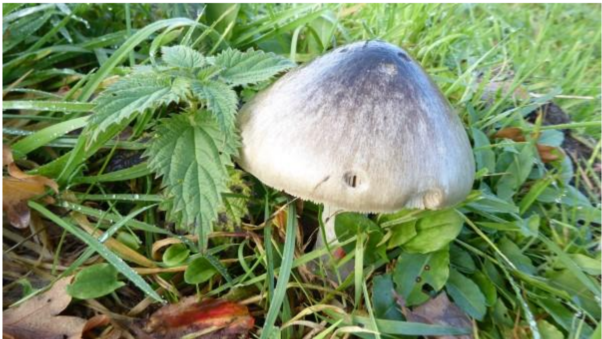
gewone beurszwam warande