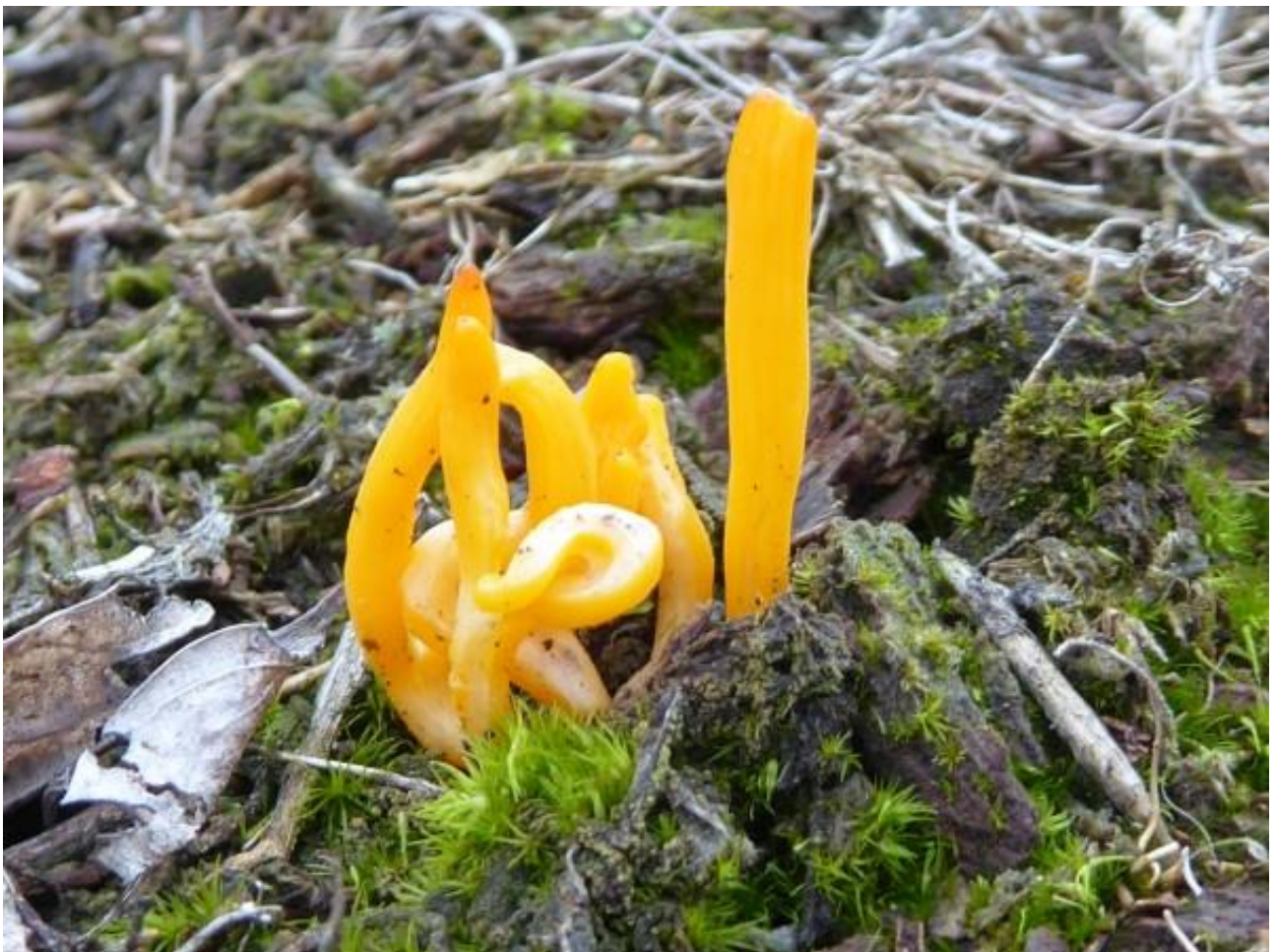
gele incl fraaie knotszwam leenderheide