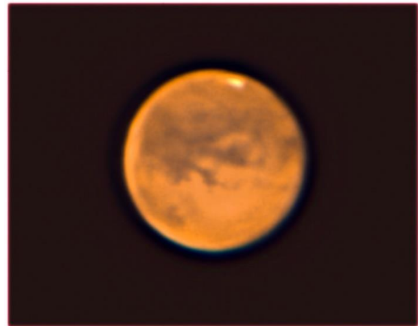
Foto is gemaakt door te filmen door de telescoop tot je 6.000 frames hebt. Daar werden de beste 1.500 beeldjes uit gekozen om er een finaal beeld van te maken.