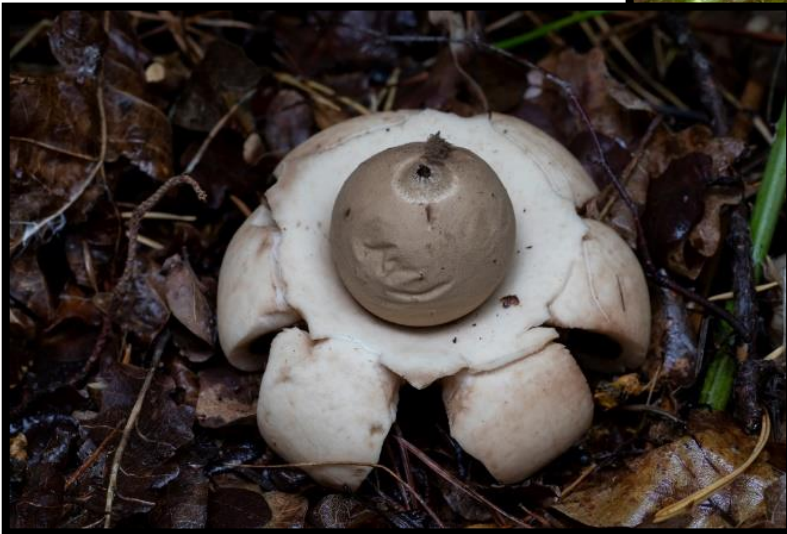
Gewimperde aardster, Grote Heide