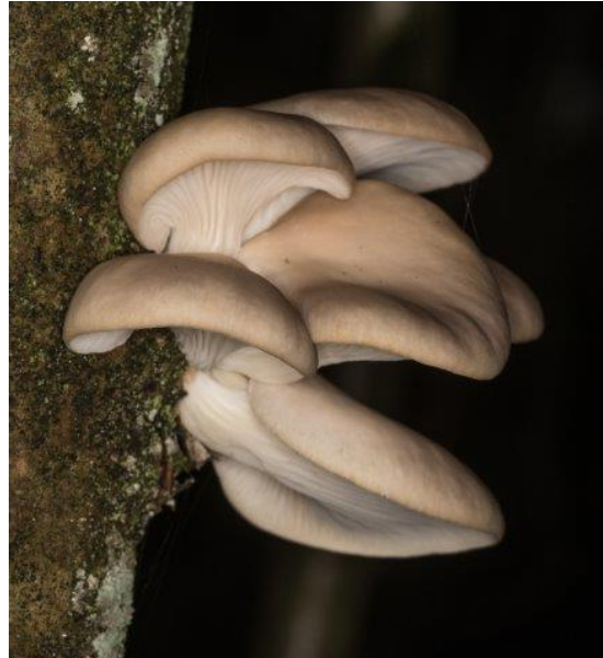
Bleke oesterzwam ??